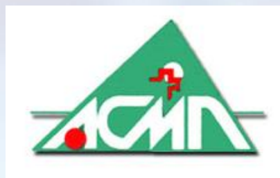
Asociace českých a moravských nemocnic